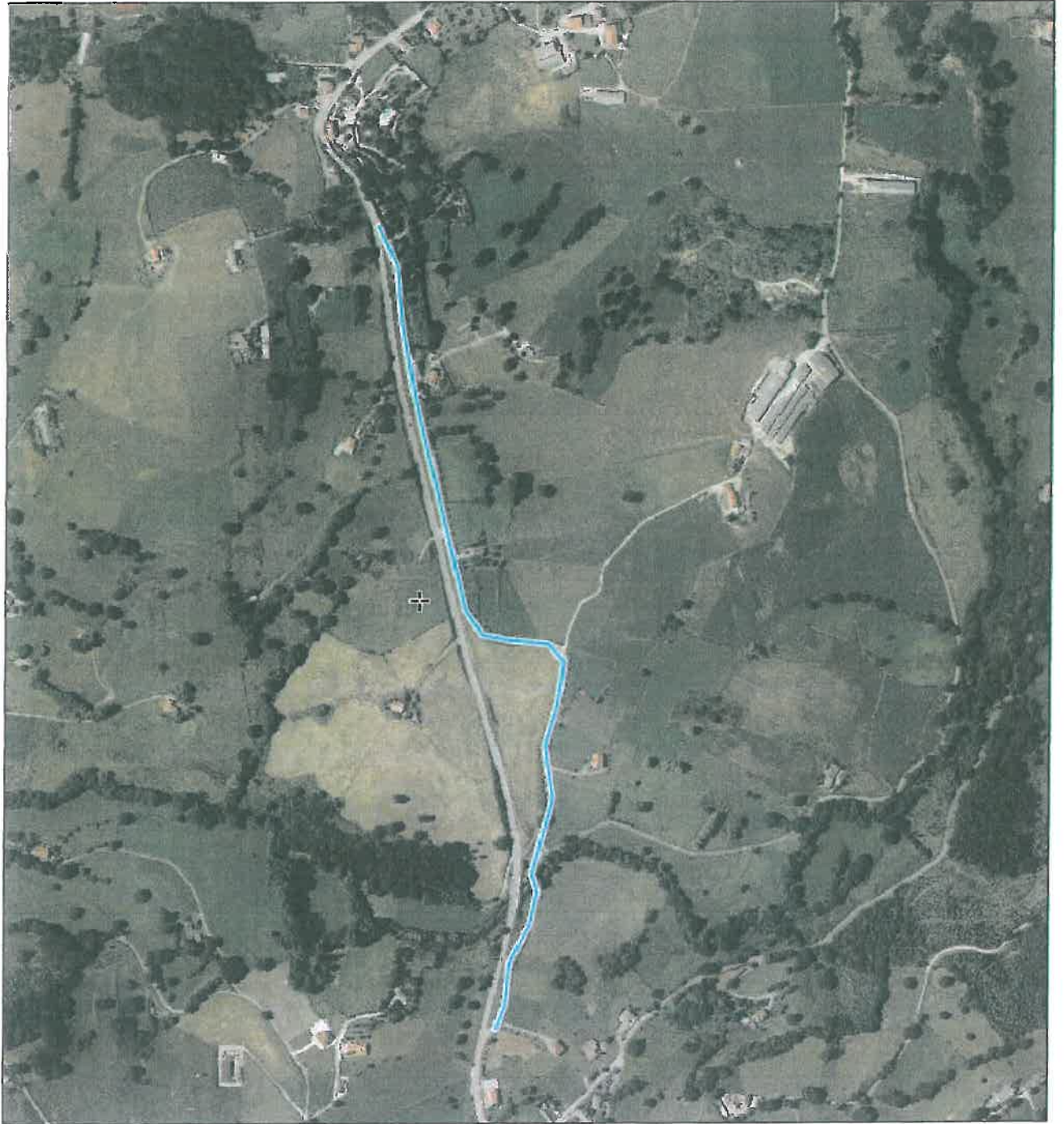
SENDA PEATONAL VALDECILLA - HERMOSA