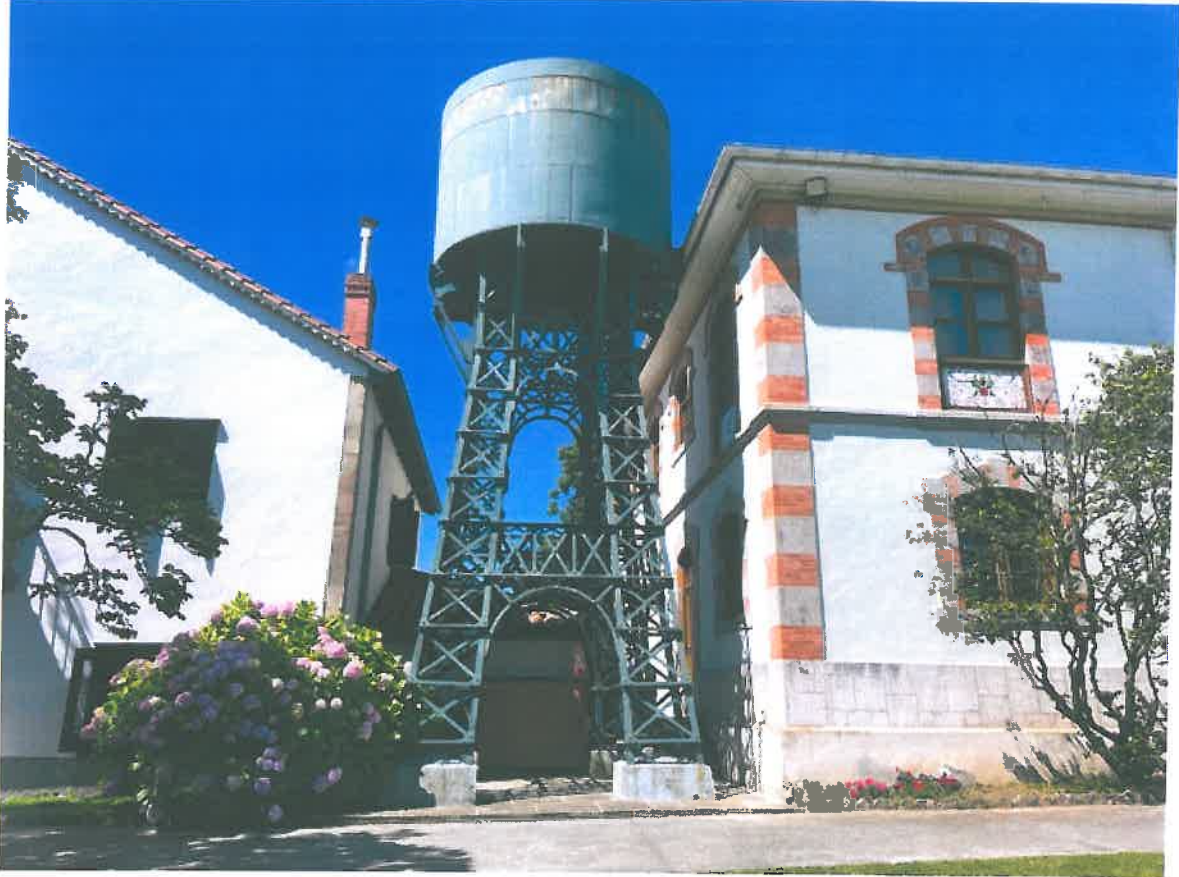
DEPOSITO DE AGUA